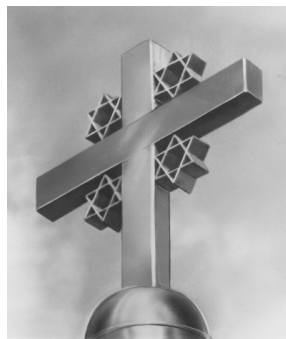
The dome-cross of the Shalom-House in Schönebeck on the River Elbe, Germany. Because of the special history of the building the cross is created as a cross with four Stars of David.

Σημαντικές πτυχές της νεότερης ευρωπαϊκής ιστορίας είναι αντικείμενο παράλληλης μελέτης. Μνημεία, όπως το Shalom-House της Γερμανίας, διδάσκουν την ειρηνική συνύπαρξη και αμοιβαία κατανόηση των διαφορετικών θρησκειών στην Ευρώπη. Το Shalom – House, άλλοτε συναγωγή των Εβραίων και σήμερα χριστιανικός ναός, στον οποίο έχουν πρόσβαση και Ιουδαίοι, αποτελεί σημείο αναφοράς για την τελευταία ρατσιστική θρησκευτική δίωξη ετεροθρήσκων κατά τη διάρκεια του Β' Παγκοσμίου Πολέμου.