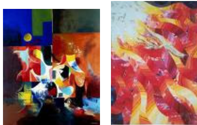
The Pentecost- oil canvas by Alexander Sadoyan, Armenia and by Solomon Raj, India

Ιδιαίτερα σημαντική ήταν η προσπάθεια των μαθητών να ανακαλύψουν παραδόσεις άλλων λαών που ζουν ως μετανάστες στην Ευρώπη. Εικόνες από την Αρμενία, την Ινδία ή το Σουδάν ήταν μέρος των εικόνων που χρησιμοποιήθηκαν από μαθητές και εκπαιδευτικούς για την προσέγγιση των μειονοτικών πληθυσμών.