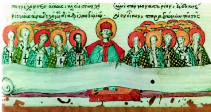
Εἰκ. 29 η : Ὁ αυτοκράτορας Μαρκιανὸς ἀνάμεσα σε ἐπισκόπους τῆς Δ' Οἰκουμενικῆς Συνόδου. Μικρογραφία ἀπὸ χειρόγραφο τοῦ 16ου αἰ. μ.Χ., Μονὴ Βατοπαιδίου, Ἅγιον Ὄρος.

Σημαντικὸ στοιχεῖο τῆς τεχνικῆς ἀριότητος ἦταν ἡ πλήρης ἀναγραφὴ ὅλων τῶν στοιχείων τῶν εἰκόνων. Ὁ μαθητὴς μπορεῖ νὰ πληροφορηθεῖ ὄχι μόνον τὸν τίτλο, ἀλλὰ καὶ τὸ εἶδος τῆς τέχνης (π.χ. μικρογραφία, τοιχογραφία...), τὸ χρόνο, τὸ δημιουργό καὶ τὸν τόπο, ὅπου τὸ συγκεκριμένο ἔργο βρίσκεται σήμερα.